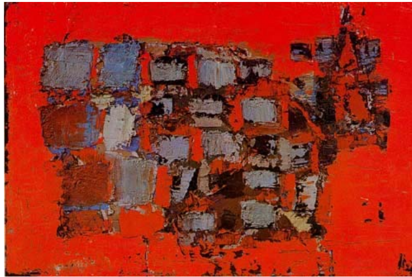
Composition sur fond rouge (1951) Nicolas De Staël